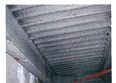
アスベスト含有吹付け ロックウール (鉄骨材の耐火被覆)