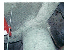
吹付けアスベスト (鉄骨材の耐火被覆)

建築基準法において規制対象とする吹付石綿等が施工されているおそれのある建築物に対しては、地方公共団体が調査および除去等の費用の一部を補助している場合があるので、お近くの地方公共団体にご相談ください。